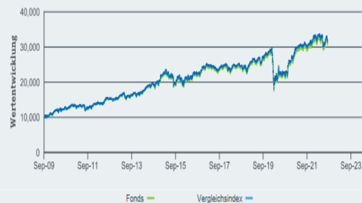
WERTENTWICKLUNG VON 10.000 EUR SEIT AUFLAGE DES FONDS

Der Fonds strebt die Nachbildung der Wertentwicklung eines Index an, der aus 100 Aktien mit führenden Dividendenrenditen besteht, die unter Unternehmen aus Europa, Nordamerika und dem asiatisch-pazifischen Raum ausgewählt wurden.